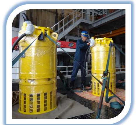
14インチ 水中ポンプ