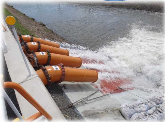
用水水替え設備 50m 3 /min (14インチ水中ポンプ×4台)

河川工事における大水量の水替え工で使用可能な、 大型の水中ポンプのラインナップ。