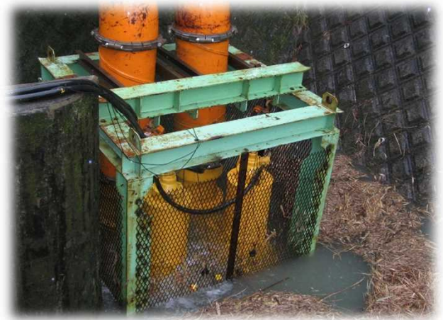
能力20m 3 /minの大型水中ポンプ×2台