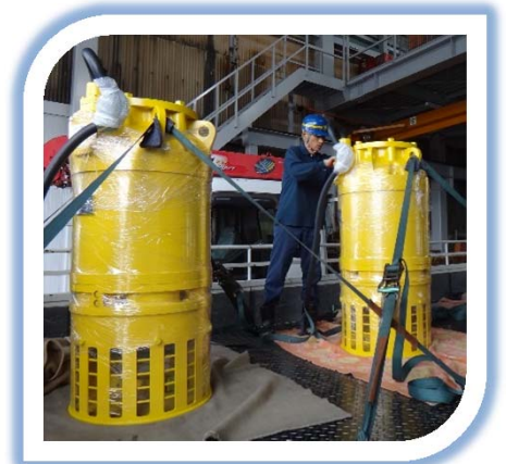
14インチ 水中ポンプ